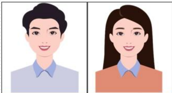
正确格式照片示例

※ 为提高识别率，拍照时请将头发梳理至耳后，摘掉眼镜和帽子，正面拍照；请选择背景简单清晰的环境，使用手机原相机直接拍摄照片，避免在强光和黑暗环境中采集。正确示范如下：